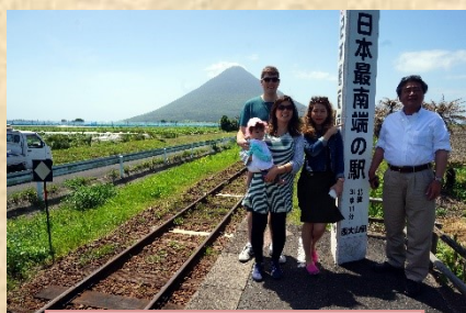
日本最南端の駅 西大山駅にて

残っており、娘達にも、その空気も含め知ってもらいたいと、切望していたことが実現できました。