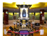
ヒルシャ 大佛殿内部