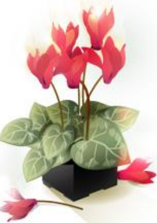
篝火花 かがりびばな

さて、今春より創刊させて頂きました『イシモトかわら版 架け橋』も今回で第3号となりましたが、このかわら版を通じ皆様と新たな繋がりを持つことができました事、また思っておりました以上に皆様より励ましの声や御連絡を頂きました事に改めて御礼申し上げます。また、人事に関しまして、私が本年