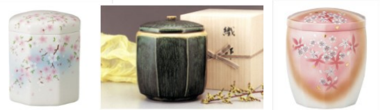
個性豊かで色とりどりの骨壺

ご先祖様のお骨で納骨所内がすでに一杯になっている場合は事前に散骨整理を致します。壺からお骨を取り出し納骨所内に蒔いてから新しい砂を被せて整地をすれば綺麗になります。