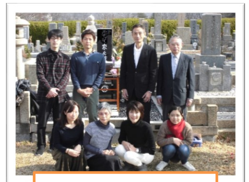
みなさんで記念撮影