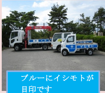
ブルーにイシモトが目印です