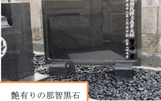
艶有りの那智黒石